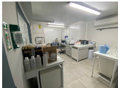
Un nouvel espace laboratoire à Crolles pour TERA environnement