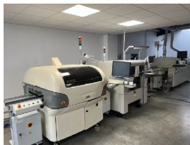
OMWAVE, ligne de production (Toulouse)

Les partenariats avec les intégrateurs se renforcent encore et nous accompagnons de plus en plus nos clients dans l'intégration de nos capteurs, ceci afin d'accélérer le cycle de vente tout en maîtrisant le bon fonctionnement des produits finaux. Cette dernière activité a d'ailleurs été renforcée avec la prise de contrôle par TERA Sensor en novembre 2023 de la SAS Omwave, société spécialisée dans la connexion des objets dans des domaines de la santé, de la robotique, de l'énergie et de l'information afin de les rendre simples d'utilisation et sécurisés. Il est à noter que TERA Sensor travaillait en sous-traitance avec Omwave depuis près de 5 ans et que la société basée à Paris et à Toulouse possède une ligne de production pour les cartes électroniques.